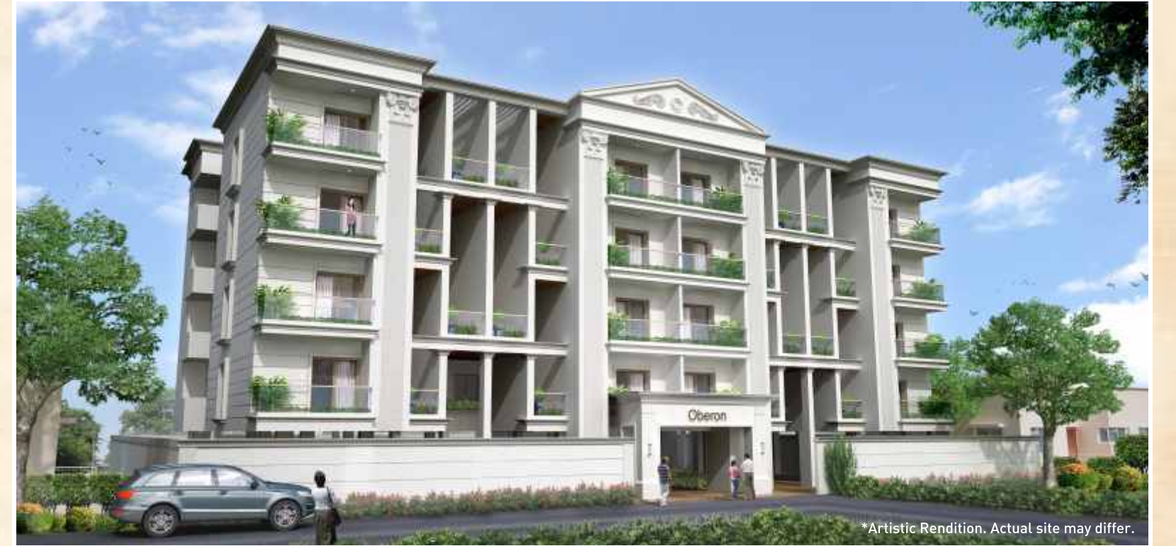
*Artistic Rendition. Actual site may differ.