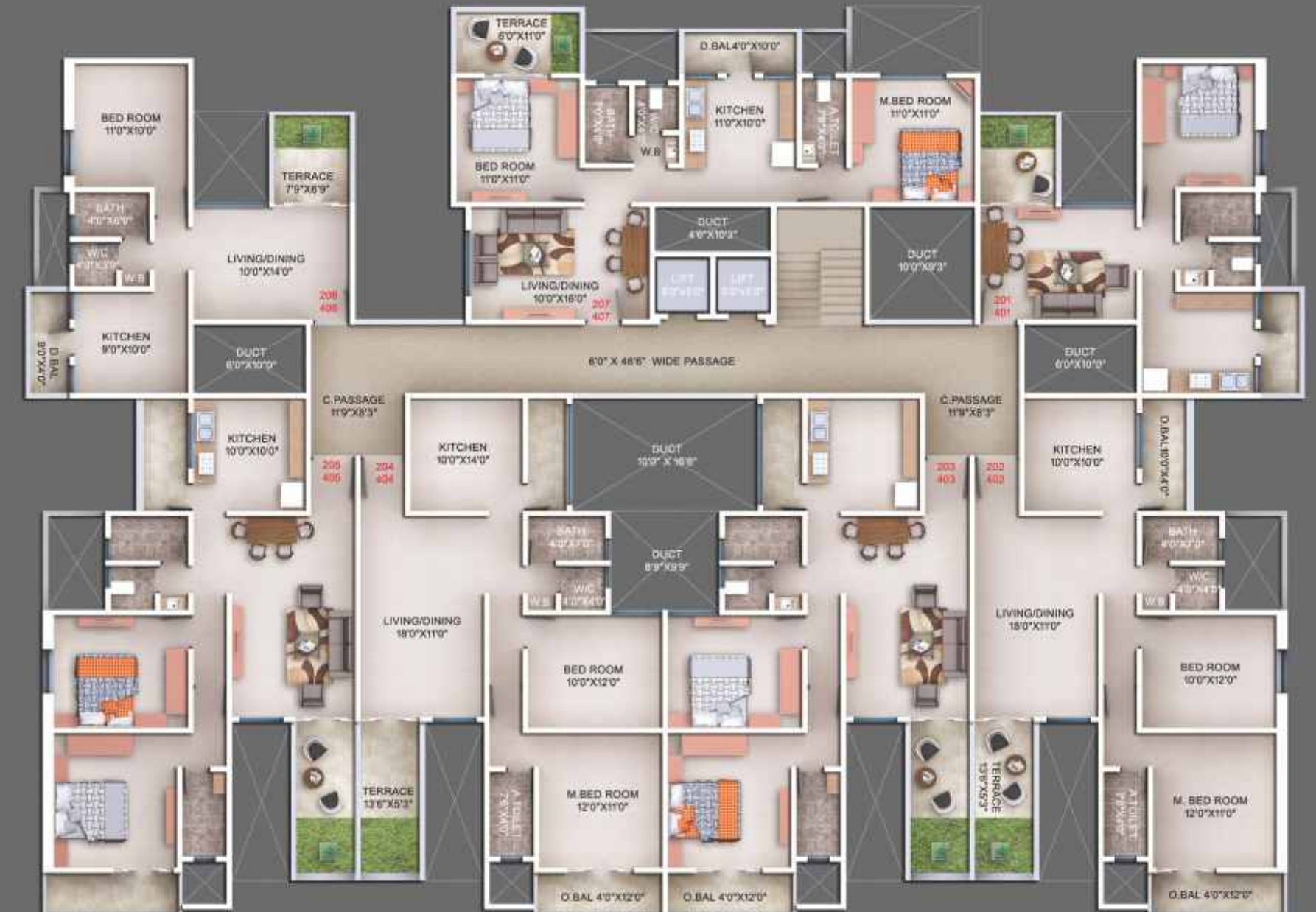
2nd, 4th Floor Plan

*Artistic Rendition. Actual site may differ.